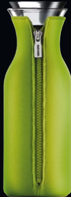
Romeo (eva solo)