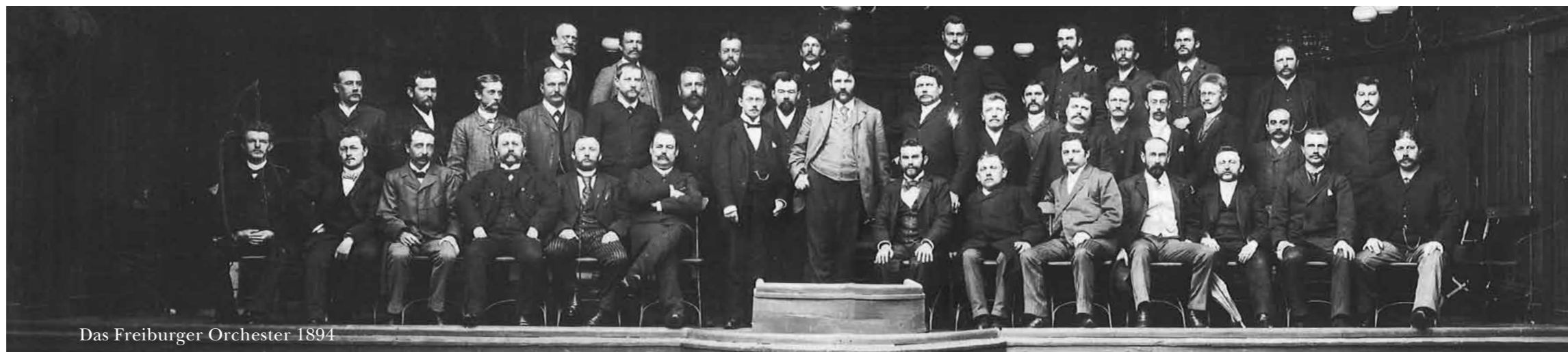
Das Freiburger Orchester 1894